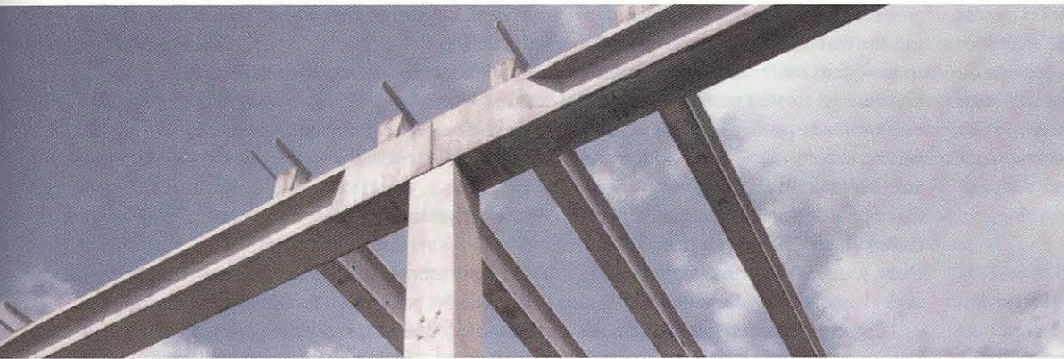
Structo, poutres en beton/betonbalken